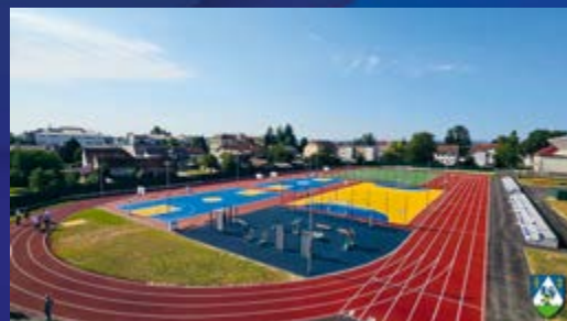
Igralište Srednje škole Koprivnica