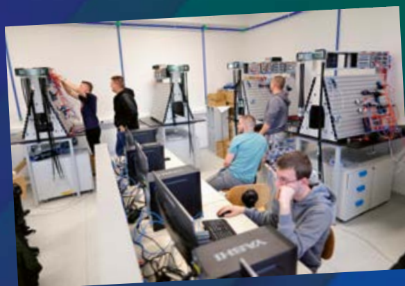
Nova oprema u Centru kompetentnosti u Đurđevcu