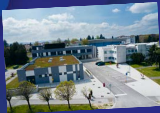
Centar kompetentnosti u Koprivnici

Koprivničko-križevačka županija kontinuirano kreira i prati projekte s ciljem omogućavanja jednake dostupnosti obrazovanja, poticanja izvrsnosti učenika, brige o zdravlju i zdravim navikama djece.