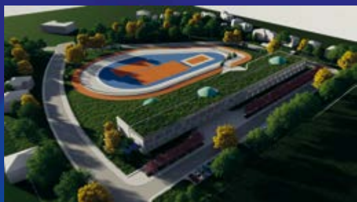
Buduća zgrada Srednje škole Koprivnica