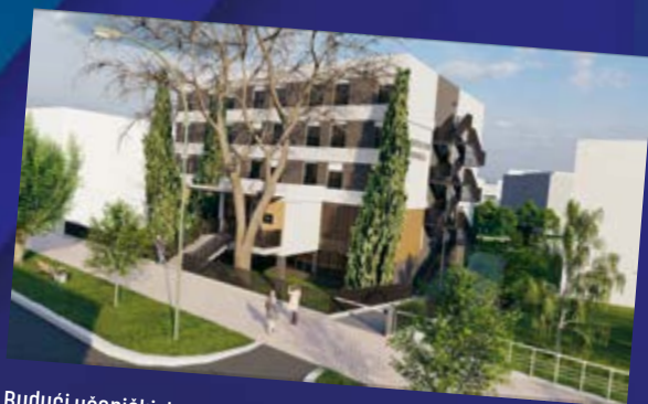
Budući učenički dom u Koprivnici