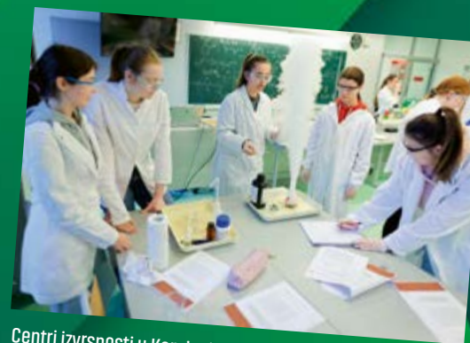
Centri izvrsnosti u Koprivnici, Križevcima i Đurđevcu

Priprema dokumentacije za novi investicijski ciklus - prijava na EU fondove, stvaranje još boljih materijalnih uvjeta obrazovanja.