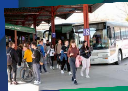
Prijevoz učenika srednjih škola