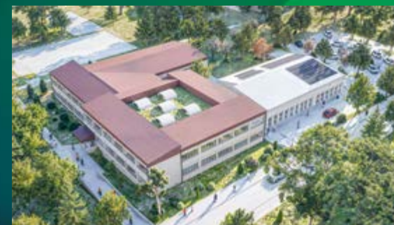
Gimnazija Ivana Zatkardija Dijankovečkoga Križevci nakon dogradnje