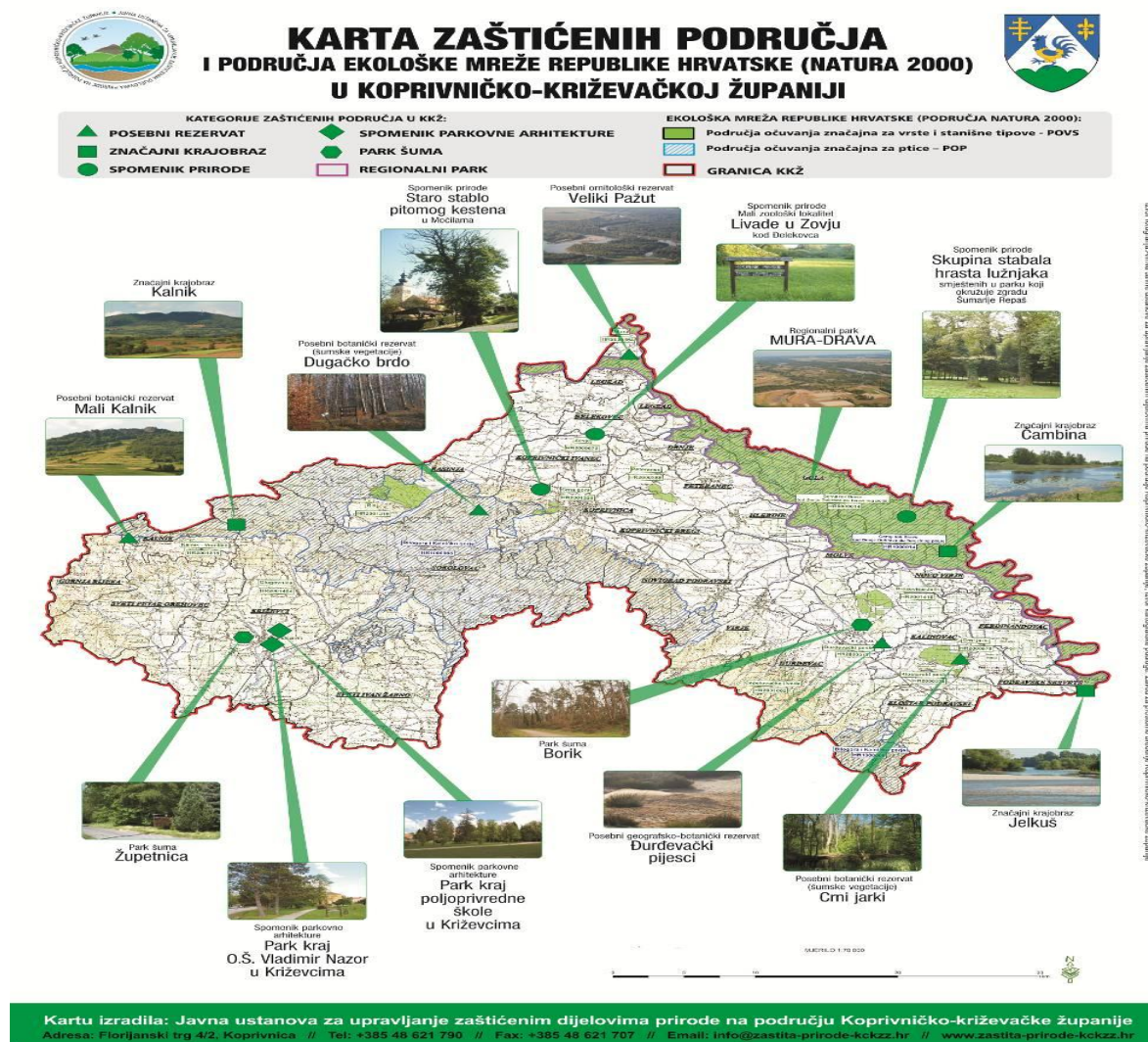
Slika 2. Karta zaštićenih područja i područja Ekološke mreže NATURA 2000 u Koprivničko-križevačkoj županiji

Kartu izradila: Javna ustanova za upravljanje zaštićenim dijelovima prirode na području Koprivničko-križevačke županije Adresa: Florijanski trg 4/2, Koprivnica // Tel: +385 48 621 790 // Fax: +385 48 621 707 // Email: info@zastita-prirode-kckzz.hr // www.zastita-prirode-kckzz.hr