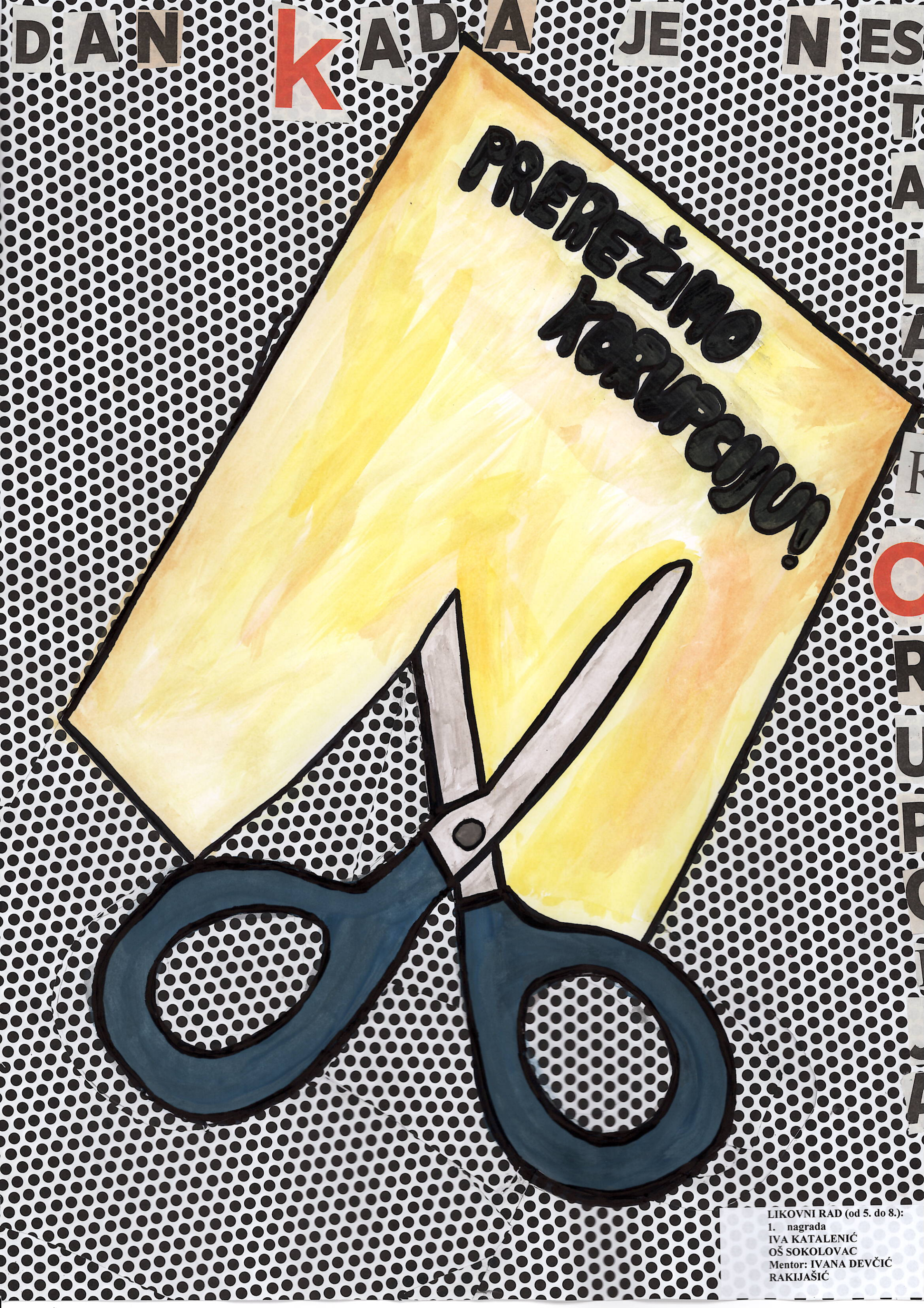
LIKOVNI RAD (od 5. do 8.): 1. nagrada IVA KATALENIĆ OŠ SOKOLOVAC Mentor: IVANA DEVČIĆ RAKJAŠIĆ