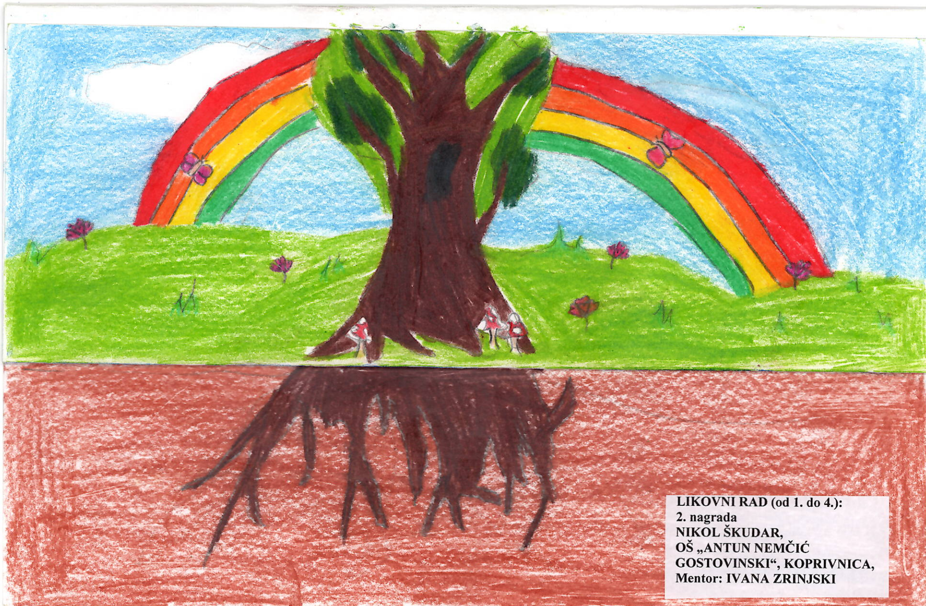
LIKOVNI RAD (od 1. do 4.): 2. nagrada NIKOL ŠKUDAR, OŠ „ANTUN NEMČIĆ GOSTOVINSKI“, KOPRIVNICA, Mentor: IVANA ZRINJSKI