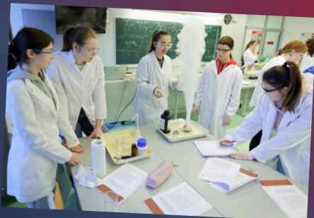
Centri izvrsnosti u Koprivnici, Đurđevcu i Križevcima