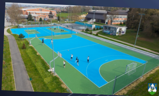
Igralište Gimnazije Ivana Zakmardija Dijankovečkoga Križevci