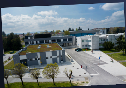
Centar kompetentnosti u Koprivnici

Koprivničko-križevačka županija aktivno ulaže u obrazovanje – ne samo u knjige i nastavni plan, nego i u prostore, opremu i uvjete u kojima svakodnevno učiš i provodiš slobodno vrijeme.