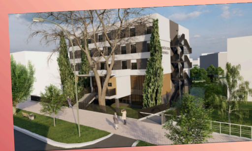
Budući učenički dom u Koprivnici