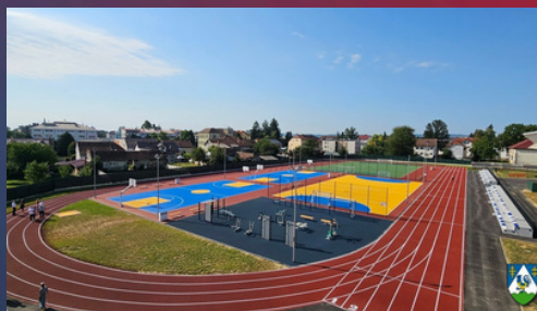
Igralište Srednje škole Koprivnica

U pripremi su i novi projekti – županija aktivno traži financiranje kroz EU fondove kako bi uvjeti školovanja postajali sve kvalitetniji.