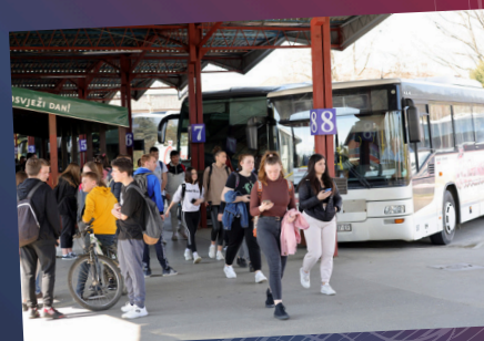
Besplatan prijevoz učenika srednjih škola