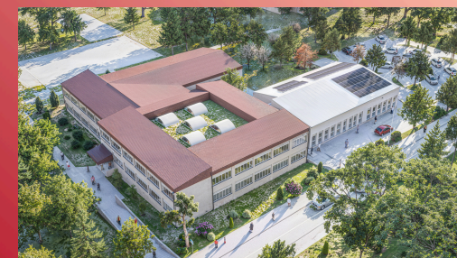
Gimnazija Ivana Zakmardija Dijankovečkoga Križevci nakon dogradnje