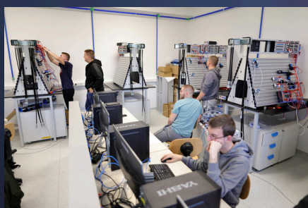
Nova oprema u Centru kompetentnosti u Đurđevcu