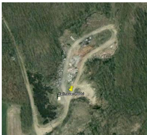
Slika 2.: Satelitske snimke odlagališta „Peski“ Kalinovac – stanje u 2006. i 2010.god.