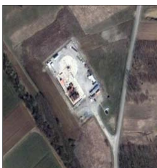
Slika 4.: Utisna bušotina Kalinovac-6 - satelitski snimak i stanje na terenu