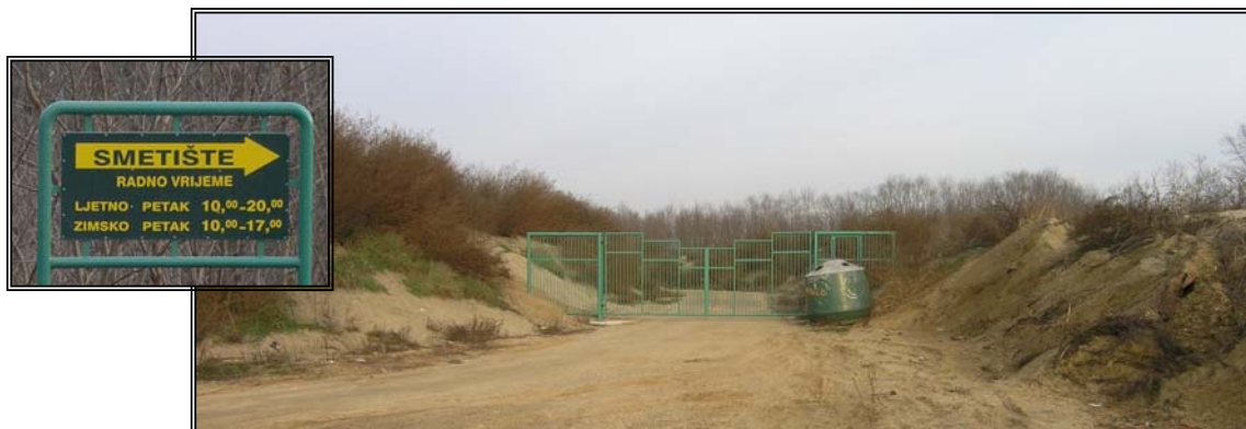
Slika 3. : Prikaz rampe na ulazu u odlagalište