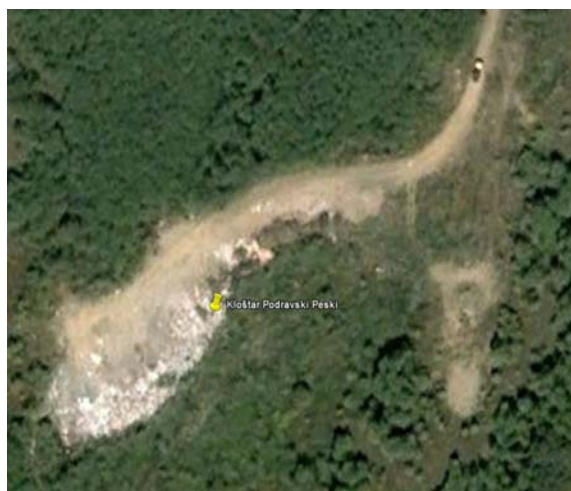
Slika 5.: Satelitske snimke odlagališta „Peski“ (toponim Draganci) – stanje u 2006. i 2010.god.

Kvalitetna sanacija odlagališta predstavlja sanaciju terena potpunim čišćenjem, izmiješanjem otpada s lokacije čime se teren vraća u doprirodno stanje što sličnije onom prije postojanja odlagališta, tzv. off-site tj. ex-situ sanacija na neko od odlagališta koje posjeduje dozvolu za rad. Prilikom sanacija, potrebno je što kvalitetnije sanirati lokaciju deponije.