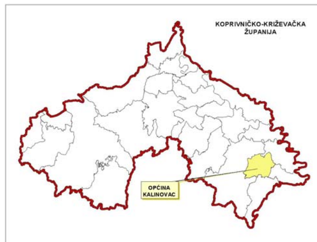
Slika 1.: Položaj Općine Kalinovac u odnosu na prostor Županije