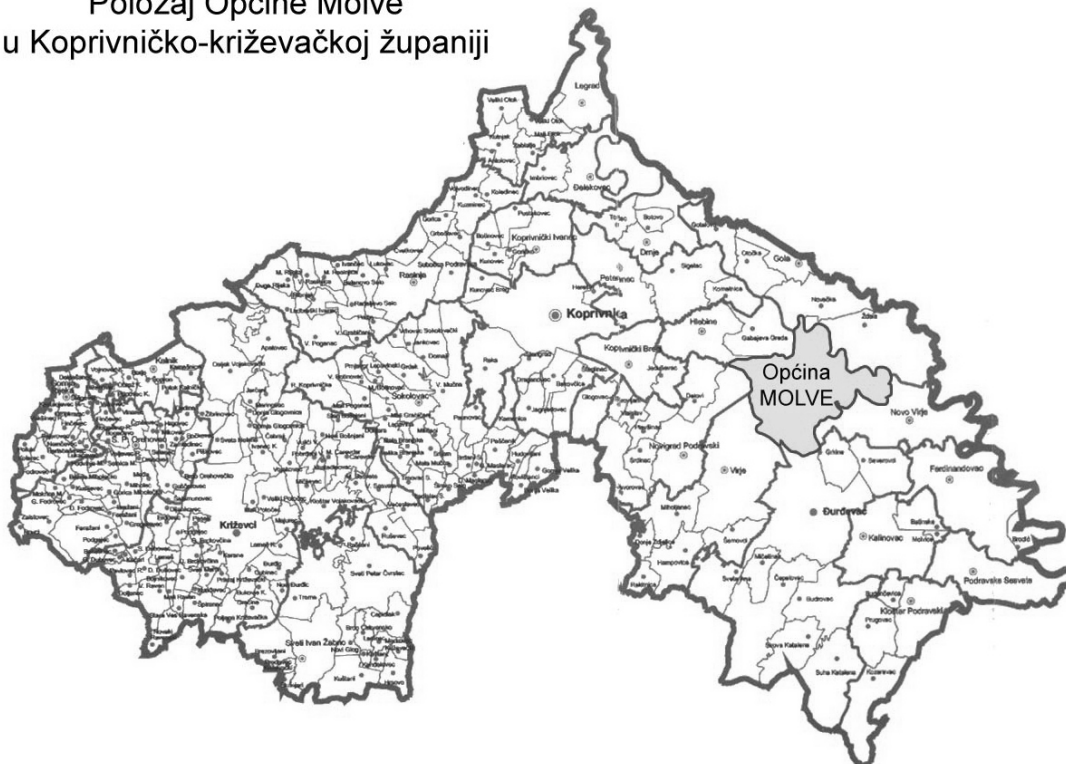
Karta: Raspored naselja na području Općine Molve